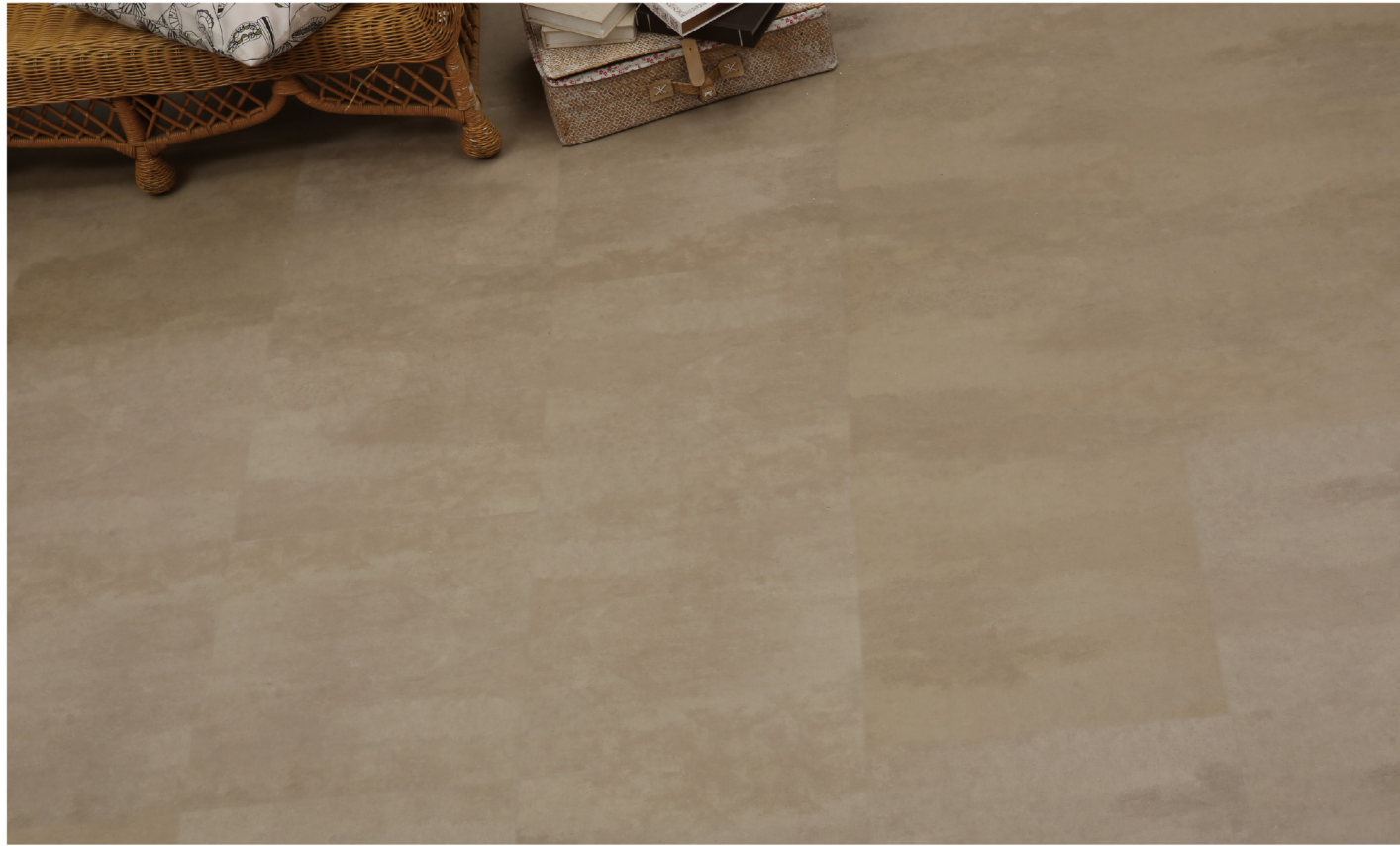
PE 70406 - Concrete original light brown