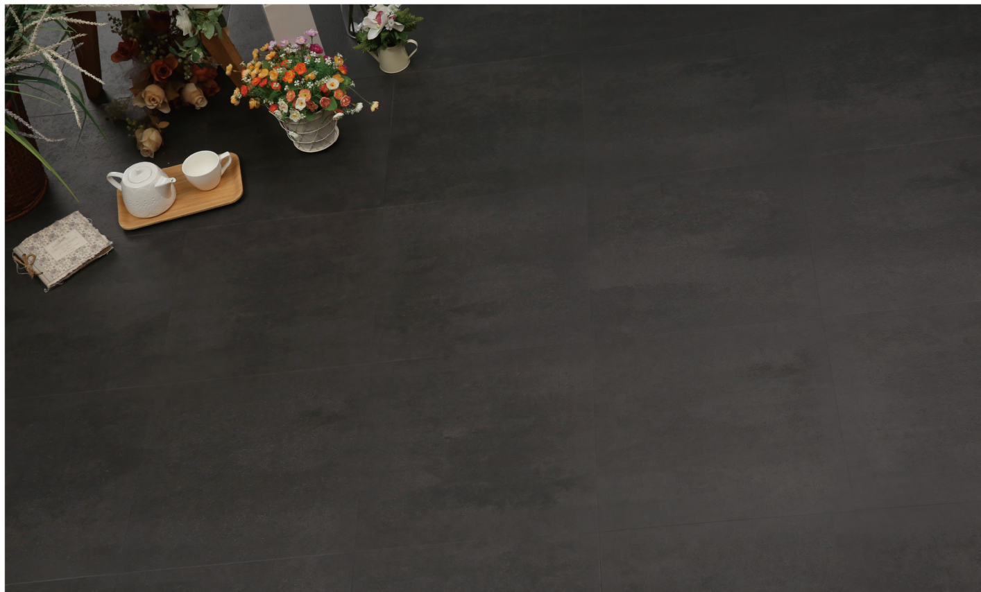
PE 70401 - Concrete original charcoal grey