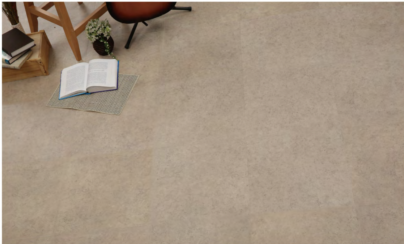
PE 70407 - Marble almond beige