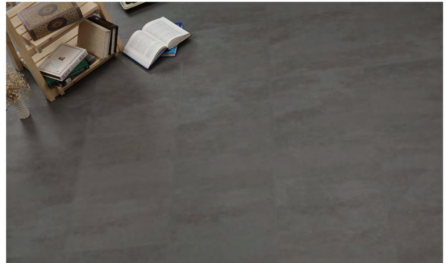
PE 70404 - Concrete original graphite grey