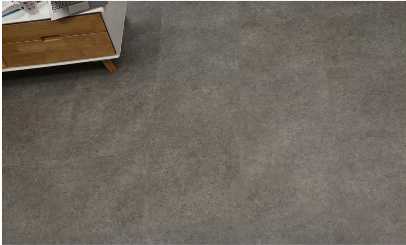
PE 70409 - Marble pewter grey