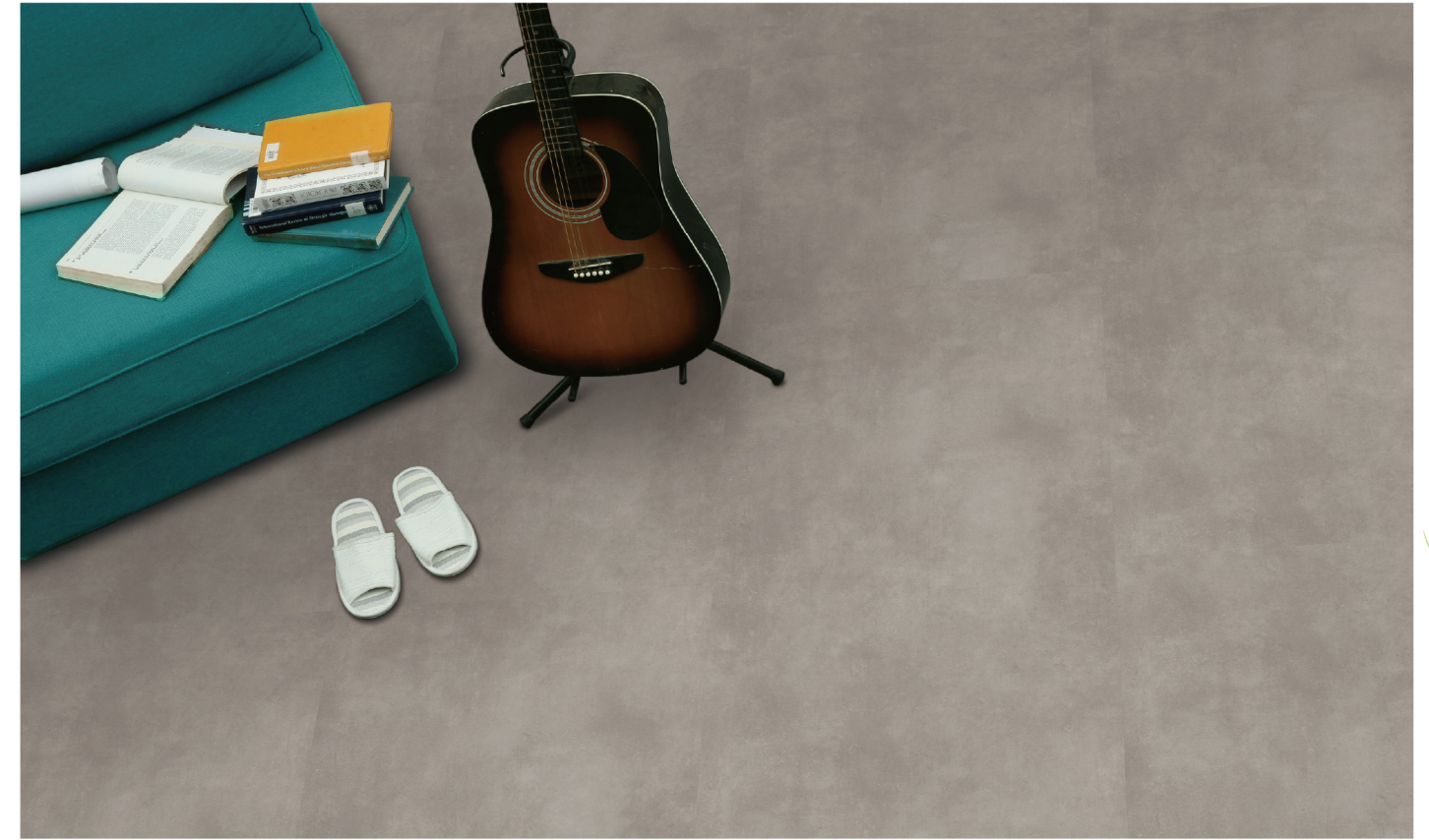
PE 70XXL 905 - Concrete original ash mist