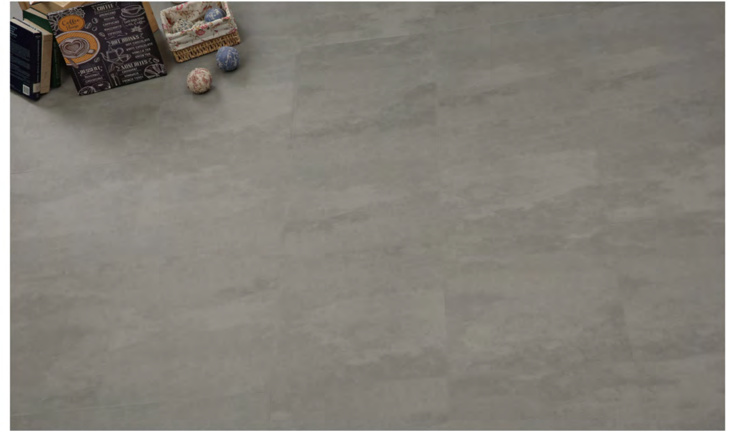
PE 70405 - Concrete original indium grey